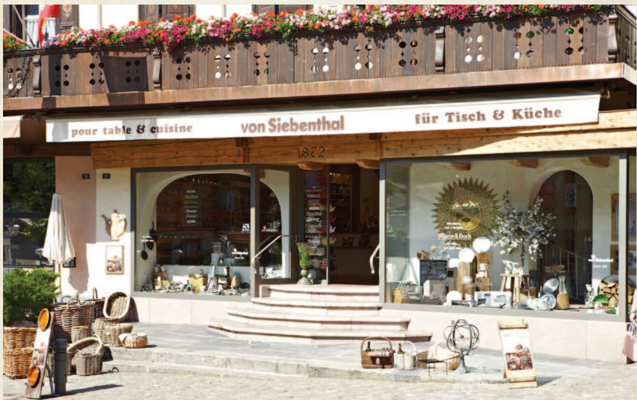
Neue Shopfront - 2011