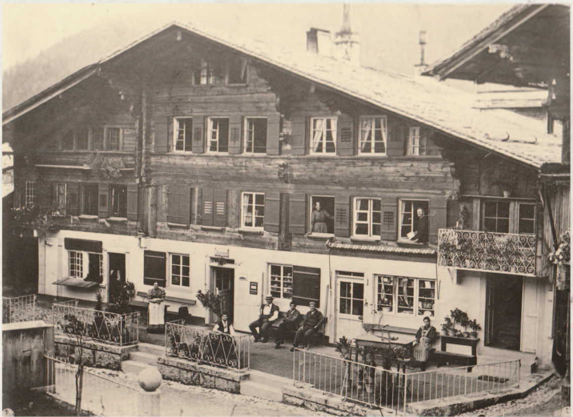
Das Geschäftshaus vor dem Gstaadbrand - ca. 1895