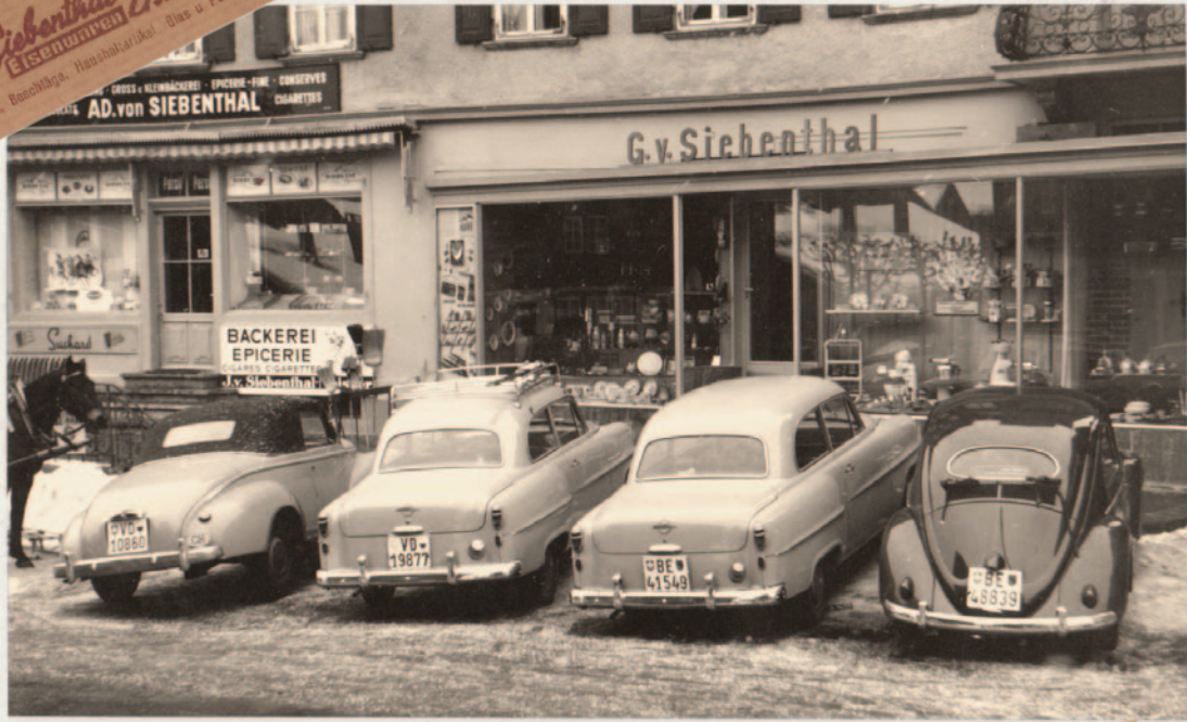
Das Geschäft - 1953